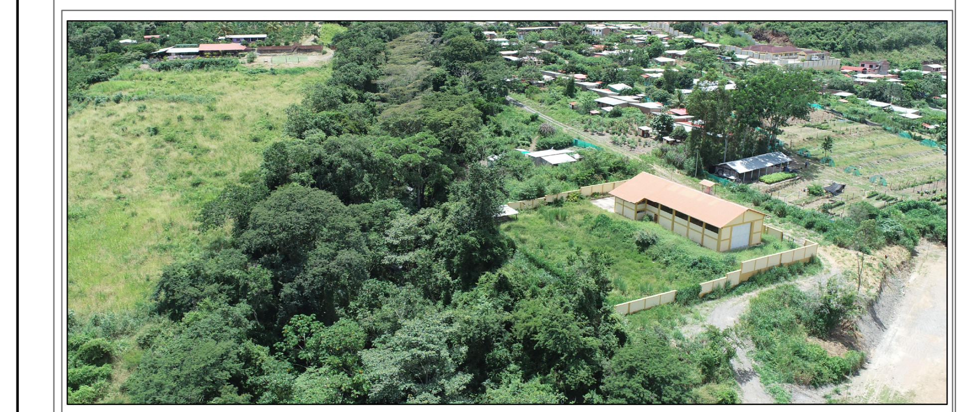
Zona de Reglamentación especial por Gestión de Riesgos de Desastres