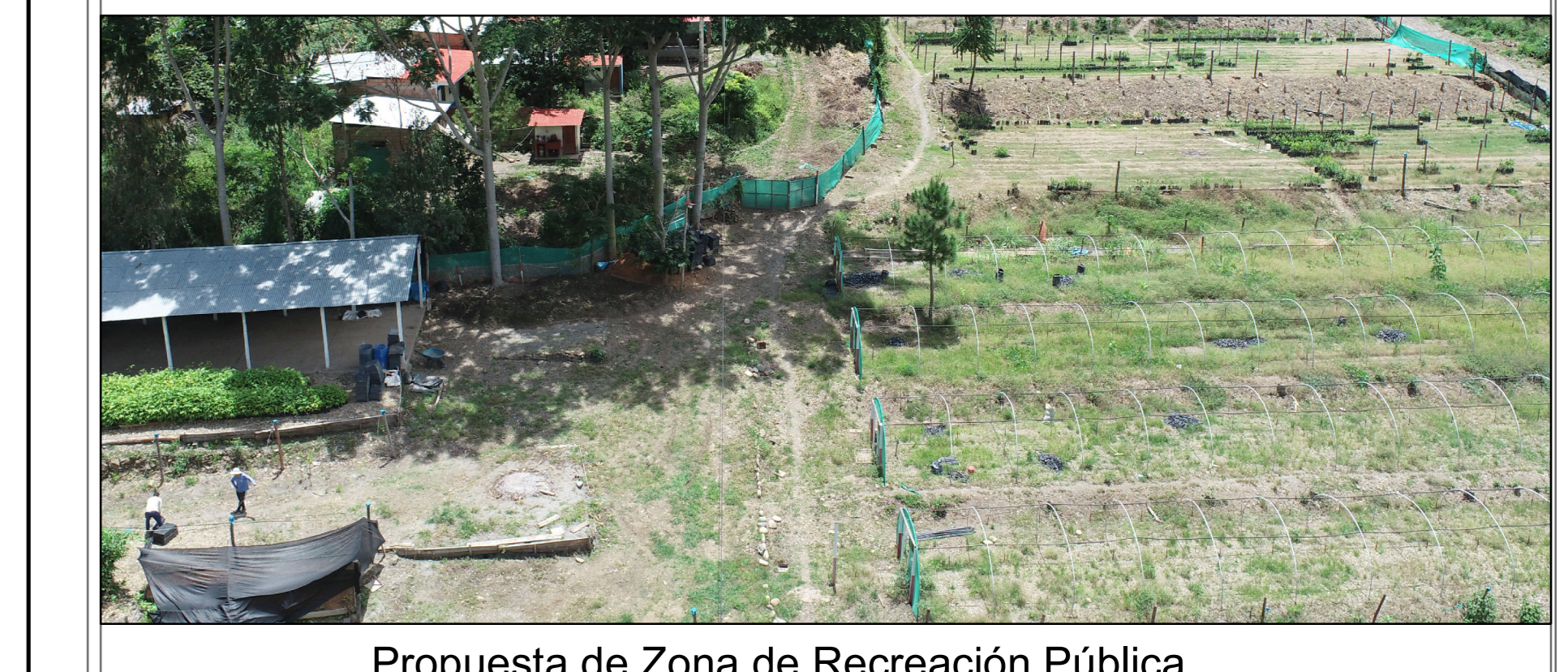
Propuesta de Zona de Recreación Pública